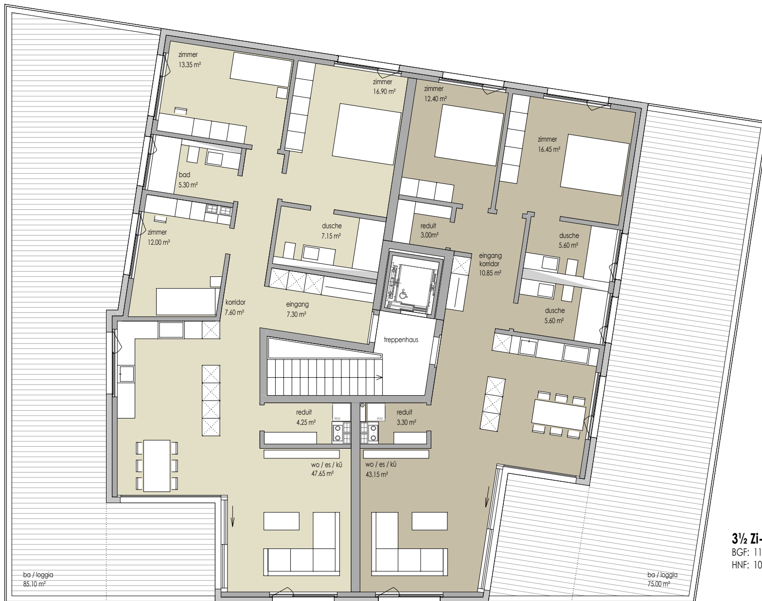
4 1/2 Zi-Whg D.4.01 BGF: 144.50 m² HNF: 121.50 m²