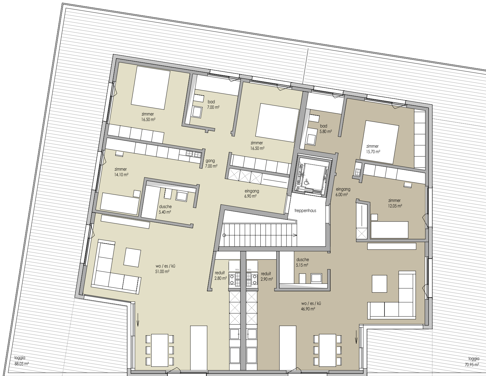
4 1/2 Zi-Whg E.4.01 BGF: 148.00 m² HNF: 127.20 m²